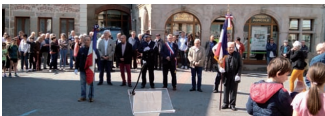
Cérémonie du 8 mai 1945 : Moment solennel de la cérémonie commémorative de l'armistice du 8 mai 1945

Samedi 4, dimanche 5 et lundi 6 juin : La fête foraine du week-end de Pentecôte faisait son grand retour !