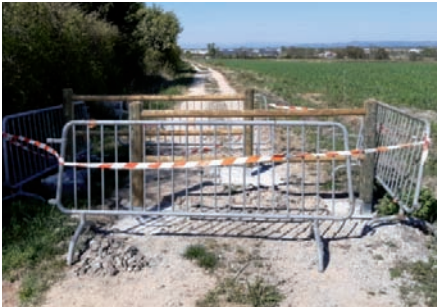
Sécurisation d'un carrefour de la voie déterrée : Travaux réalisés par les Services Techniques