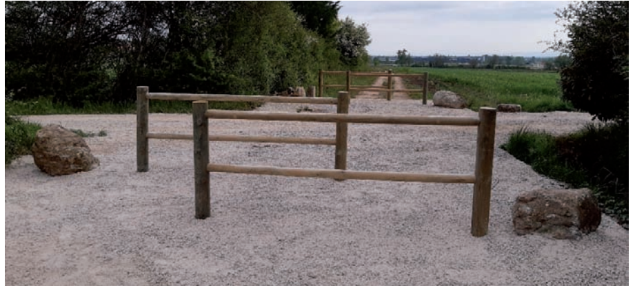
Aménagement d'une zone de croisement au niveau du pont de la Route des Cimes. Travaux réalisés par les Services Techniques