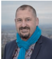
Arnaud DE MAZENOD