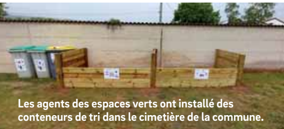
Les agents des espaces verts ont installé des conteneurs de tri dans le cimetière de la commune.

Dès à présent, vous pourrez donc retrouver des conteneurs pour le recyclage (pots de fleurs en plastique, bouteilles, films plastiques...), des conteneurs pour les ordures ménagères (mousse pour composition, fleurs et décoration plastiques, rubans), un casier pour les déchets verts (fleurs fanées, terre et plantes en motte) et un casier pour les gravats (marbre, ciment). Une caisse à dons est également mise à disposition de tous (pots et jardinières pouvant être réutilisés). Dans une optique de recyclage intégral, une zone de compostage est en cours de réflexion, afin de valoriser les biodéchets du cimetière, mais aussi de la Ville. Tous ces déchets verts seront ensuite compostés afin d'en faire du terreau qui servira à l'entretien et à l'embellissement de la commune.